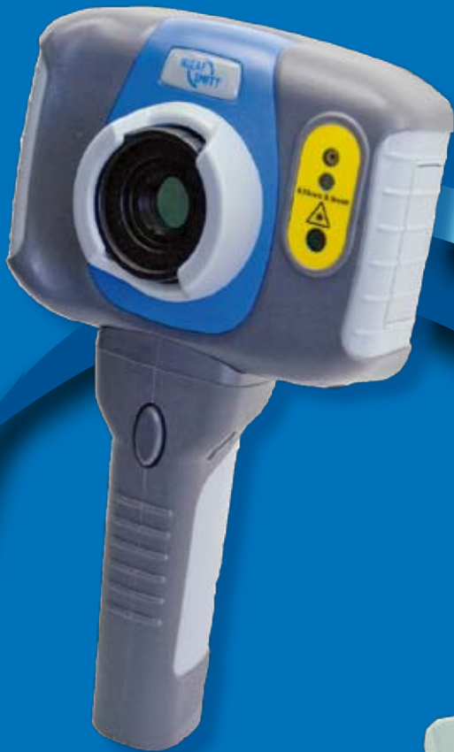
Thermografische camera - NIIR6010

Dit najaar introduceert Nieaf-Smitt o.a.: